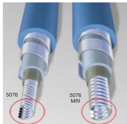
Рис. 1. Схемы традиционного (слева) и МР-совместимого (справа) электродов. Следует подчеркнуть, что МР-совместимые кардиостимуляторы предназначены для использования только с МР-совместимыми электродами

При проектировании МР-совместимого электрода разработчики стремились свести к минимуму количество тепла и электрические токи, возникающие в электроде под воздействием